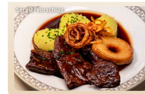
Kalbsleber „Berliner Art“

Kalbsleber „Berliner Art“ mit Portweinsauce, karamellierter Apfelscheibe, Röstzwiebeln und Kartoffelpüree Roasted calf's liver with port wine sauce, caramelised apple slice, fried onions and mashed potatoes