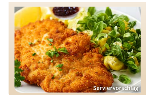
Original „Wiener Schnitzel“