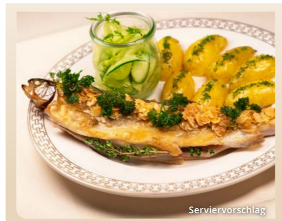
Forelle „Müllerin Art“